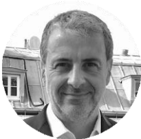
Franck Caso Conseil en propriété industrielle Cabinet In Concreto