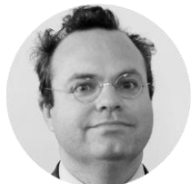
Nicolas Binctin Professeur agrégé des Facultés de droit