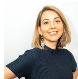
Marie Ehret-Leclere Conseil en propriété industrielle Cabinet Germain Maureau