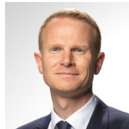
Christophe Pelèse Conseil en propriété industrielle Plasseraud IP