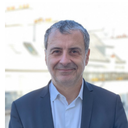
Franck Caso Conseil en propriété industrielle Cabinet In Concreto